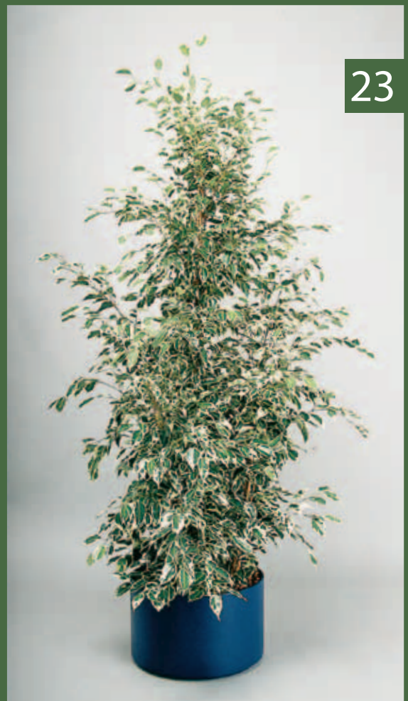
23 Ficus benjamina „Golden King“