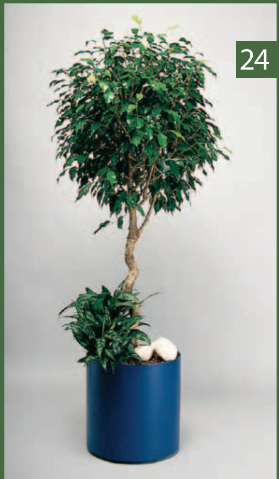
24 Ficus benjamina - Hochstamm