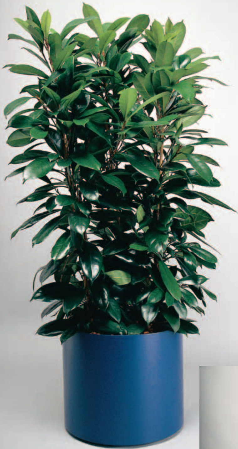
8 Ficus cyathistipula schattig - hell Kunststoffgefäß Elegance Ø 48 cm, 39 cm hoch mit verdeckten Rollen