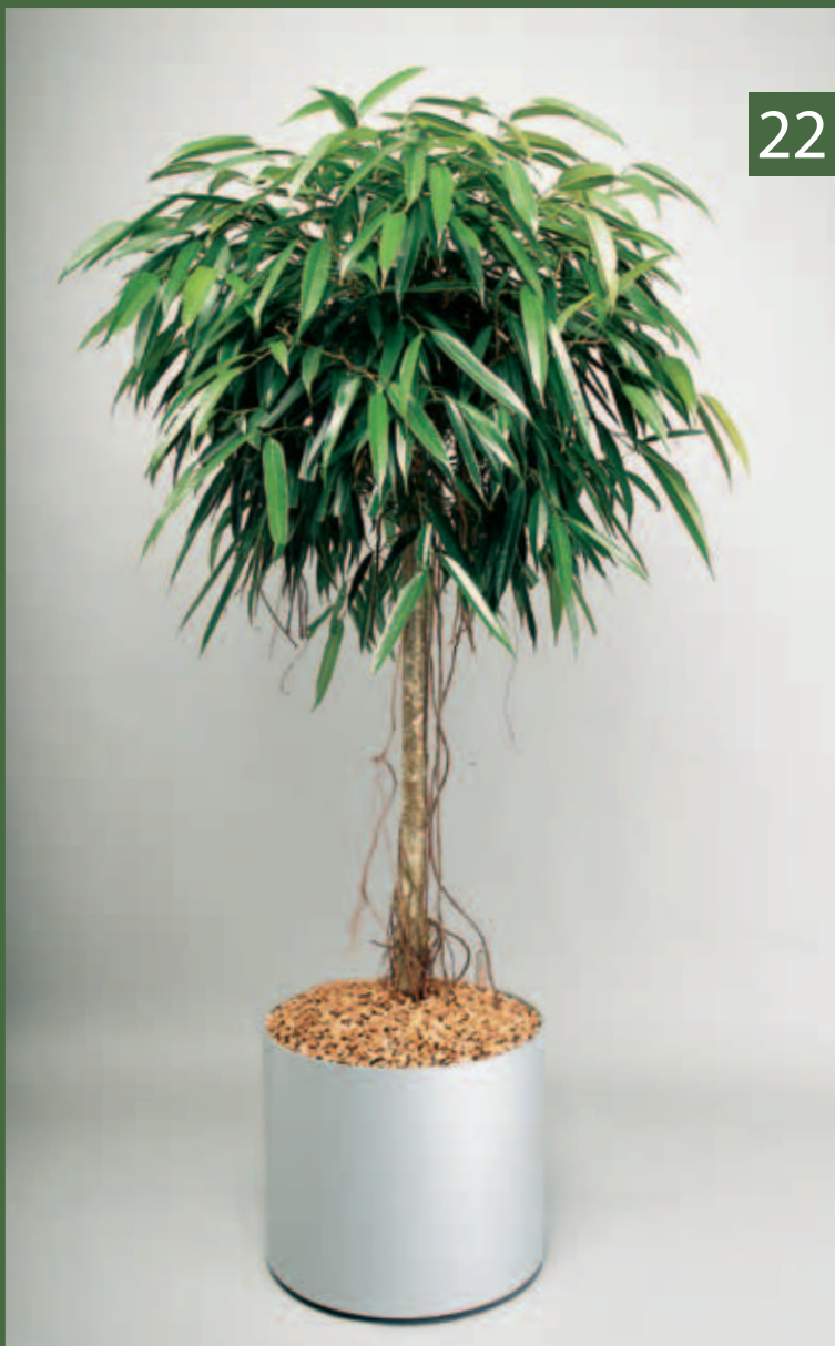
22 Ficus binnendijkii „Alii“ -Hochstamm