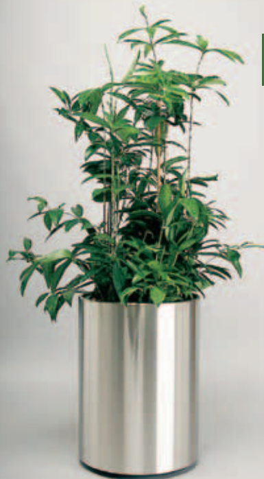
9 Dracaena surculosa schattig - hell Edelstahlgefäß Ø 37 cm, 51 cm hoch mit verdeckten Rollen